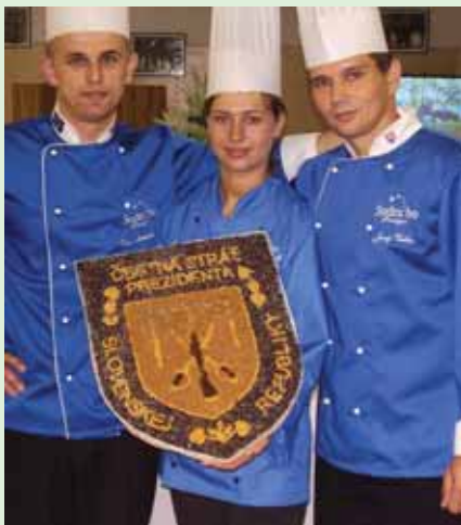
1. srpna připravilo slovenské Sodexo Prestige slavnostní recepci u příležitosti 5. výročí vzniku Čestné stráže Prezidenta Slovenské republiky

Polská divize společnosti Sodexo se rovněž zúčastnila nejdůležitější události z oblasti facility managementu, „POLISH COUNTRY FORUM“, kde mimo jiné představila svůj koncept technické podpory majetku a téma zdravého stravování a s ním související tělesné i duševní pohody.