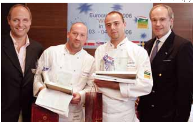
...a ani letos jsme se neměli za co stydět. Druhá pozice znamenala stříbro a další motivaci do příštího roku.