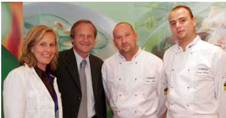
Český tým měl před sebou nelehký úkol, vloni se totiž umístil na nejvyšší příčce...