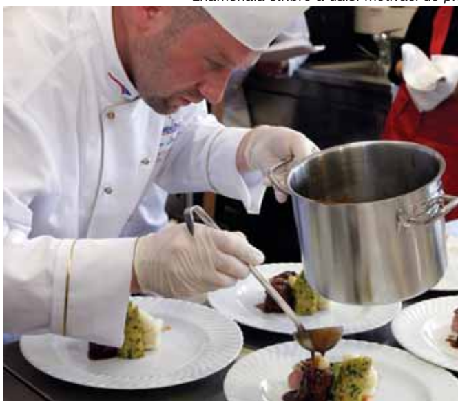
Hotové výtvary posuzovala nejen degustační porota složená ze šéfkuchařů, ale i porota technická. Výsledek tedy musel stát za to.

bodů. Skončila na druhém místě a získala cenu za profesionalitu při práci v kuchyni. Obhájit prvenství je těžší než vyhrát. Můžeme však hrdě říci, že tým kuchařů z České republiky se ani tentokrát mezi evropskými kuchaři neztratil. Osobně si myslím, že opět „vyhráli všichni, kdo se rozhodli a soutěžili“.